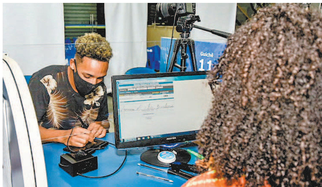
Ao todo, o Detran reabriu 17 postos em todo o estado, sendo três deles na Zona Oeste da cidade do Rio

Os serviços de habilitação precisam ser agendados nos telefones 3460-4040, 3460-4041 e 3460-4042, ou pelo site www.detran.rj.gov.br . O posto do Detran no Aerotown fica na Avenida Ayrton Senna 2.541. A unidade do West Shopping é na Estrada do Mendanha 555 e a do Américas Shopping fica na Avenida das Américas 15.500. O mutirão acontece das 10h às 17h.