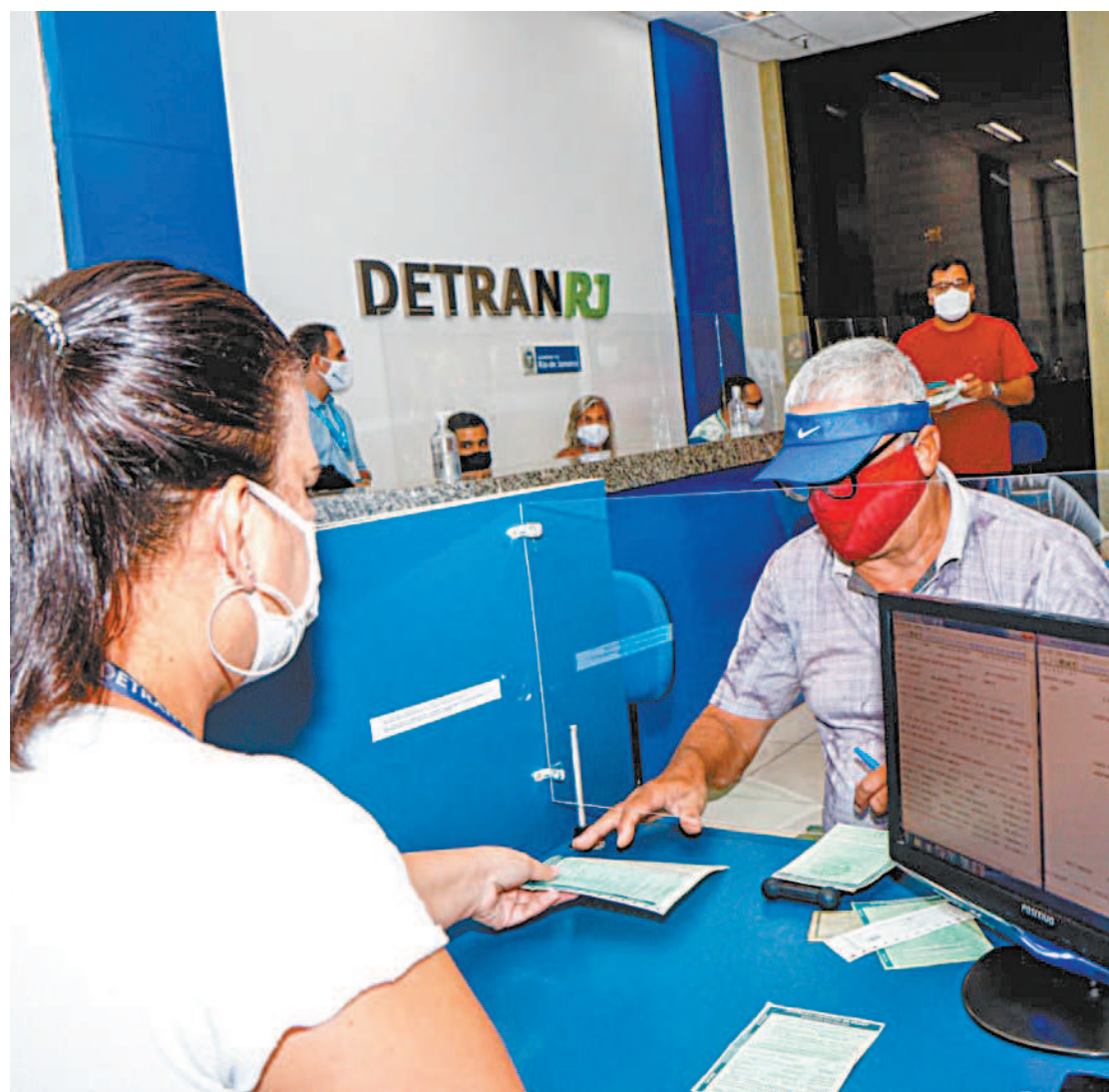
Objetivo da ação do órgão é reduzir demanda não atendida durante a pandemia do novo coronavírus