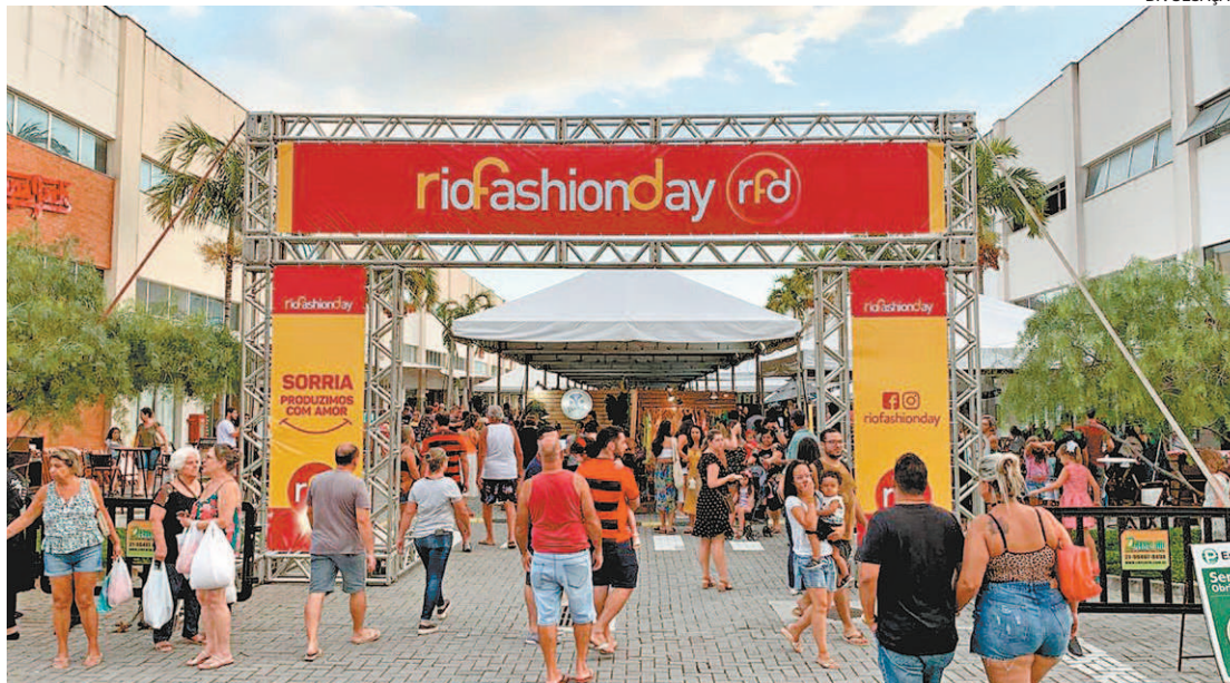
Frequentadores terão opções de moda masculina, feminina e infantil; acessórios, calçados e muito mais