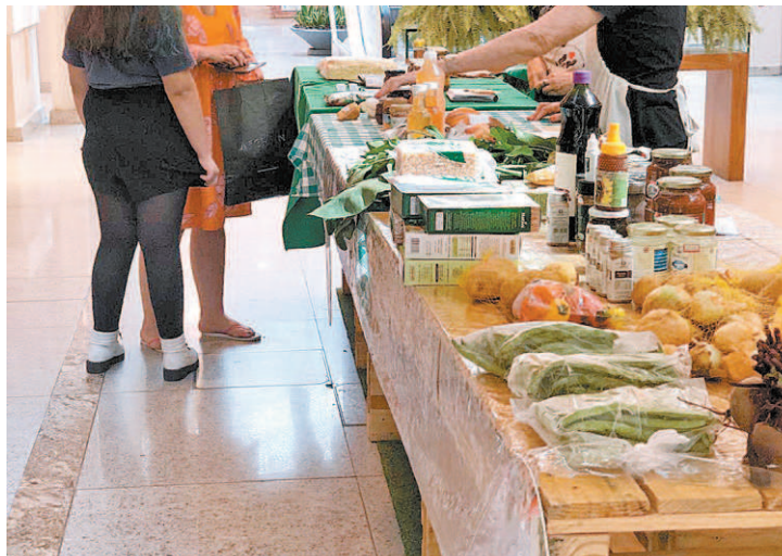
Evento conta com produtores de alimentos saudáveis, sem agrotóxicos

Os interessados na adoção precisam ter idade maior que 18 anos, estar munido de documento oficial com foto, CPF e comprovante de residência, além de assinar um Termo de Adoção. Os gatos só poderão ir para lares telados. A feira vai acontecer na Portaria 1, em frente a Fashion Biju, das 13h às 17h. O Bangu Shopping fica na Rua Fonseca 240.