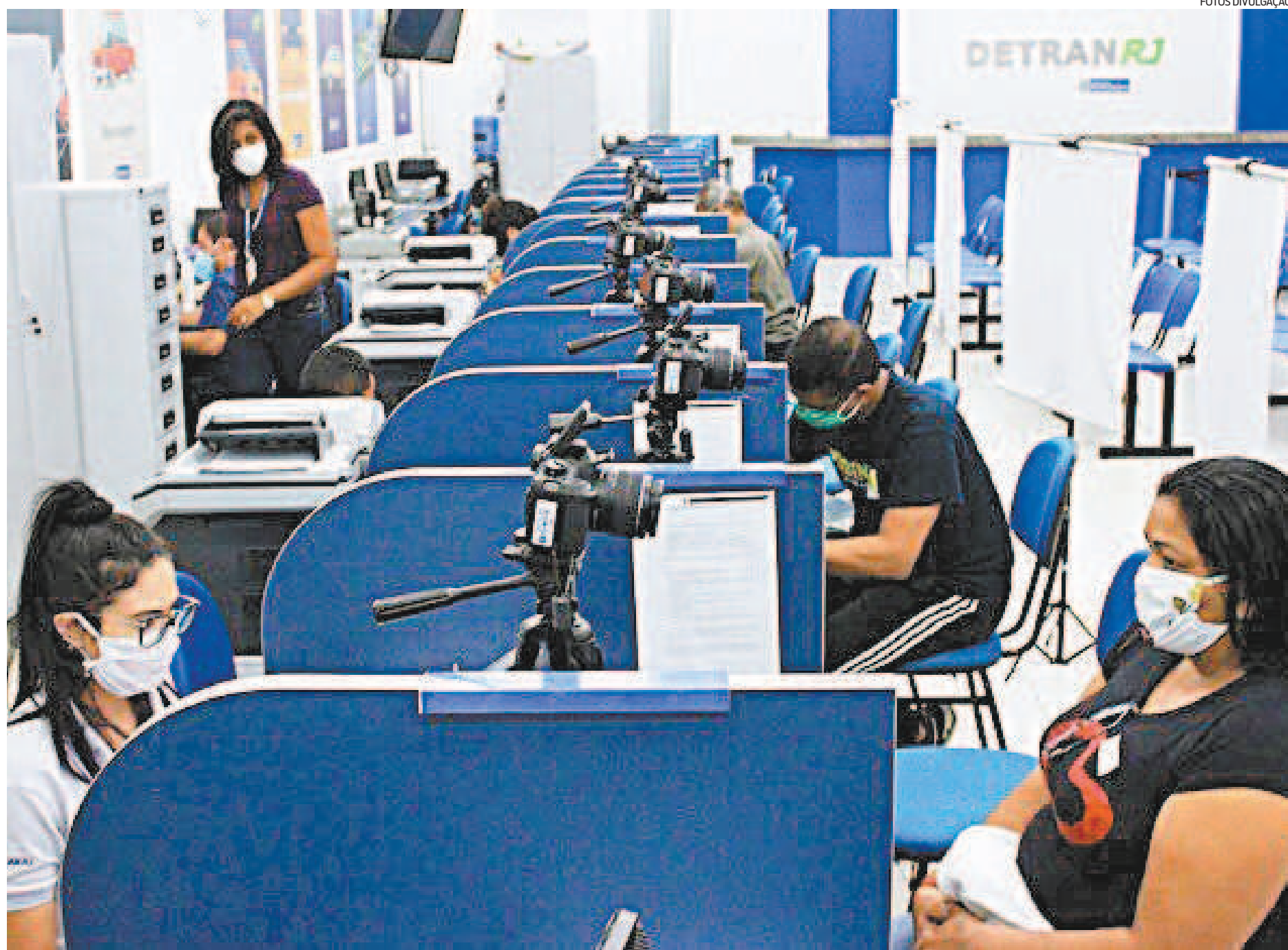
Em todo o Estado do Rio, o Detran vai disponibilizar 5 mil vagas durante mutirão de serviços no fim de semana. Procedimentos oferecidos são referentes à Carteira de Habilitação

“Verificamos que a procura por serviços de habilitação estava muito alta nessa reabertura e, por isso, optamos por um mutirão só com procedimentos deste setor. Se, ao fim de novembro, mesmo com os mutirões dos fins de semana, identificarmos que a demanda acumulada na pandemia continua grande, continuaremos com as vagas extras aos sábados e domin-