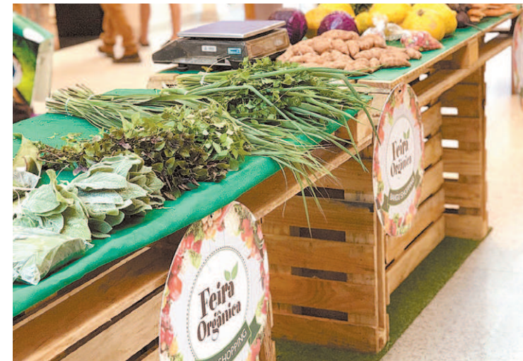
Feira orgânica tem visitação gratuita e acontece na portaria 4