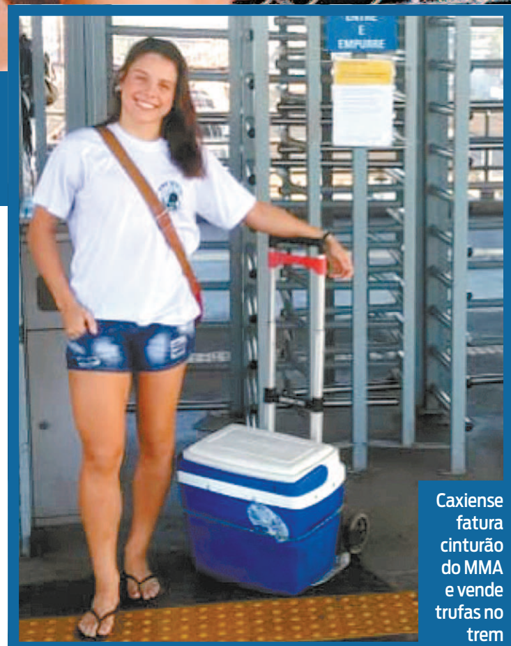
Caxiense fatura cinturão do MMA e vende trufas no trem