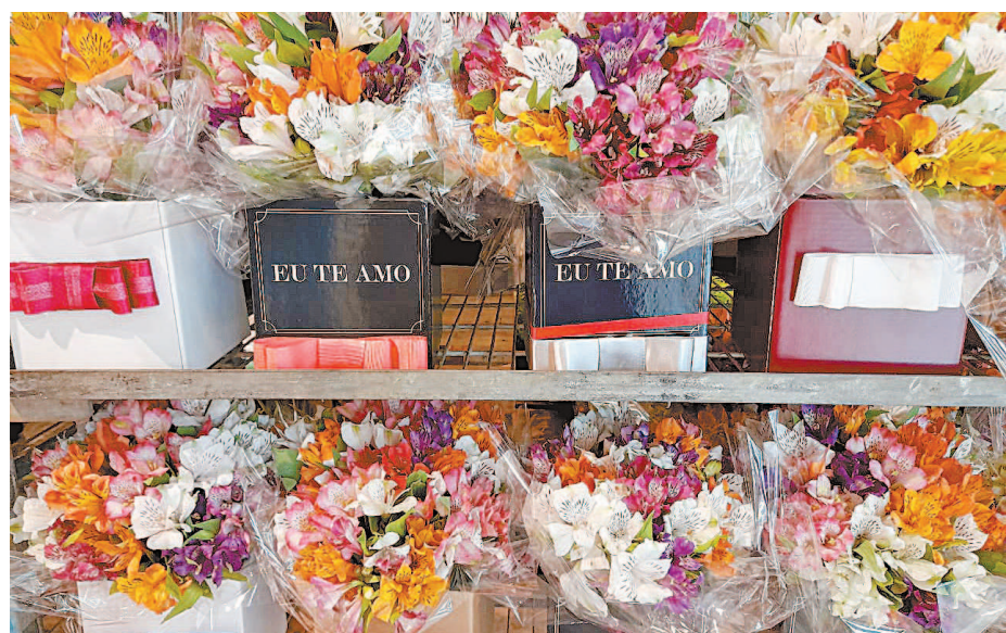
Primeira edição terá exposição, venda e demonstração de montagens de buquês e ramalhetes