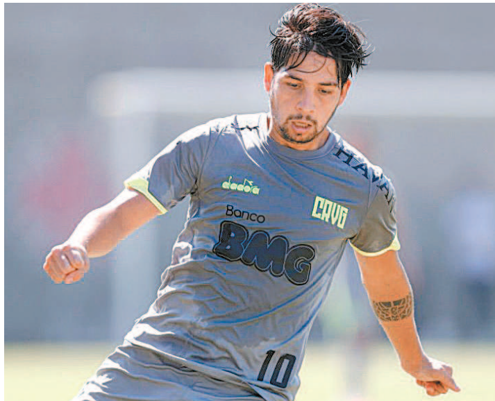
Benítez: permanência no Vasco muito perto de ser concretizada