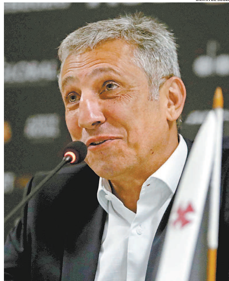
Campello não revelou os valores envolvendo a contratação de Benítez

reira, mas o goleiro vascaíno foi mais rápido e impediu a finalização do jogador do Caracas.