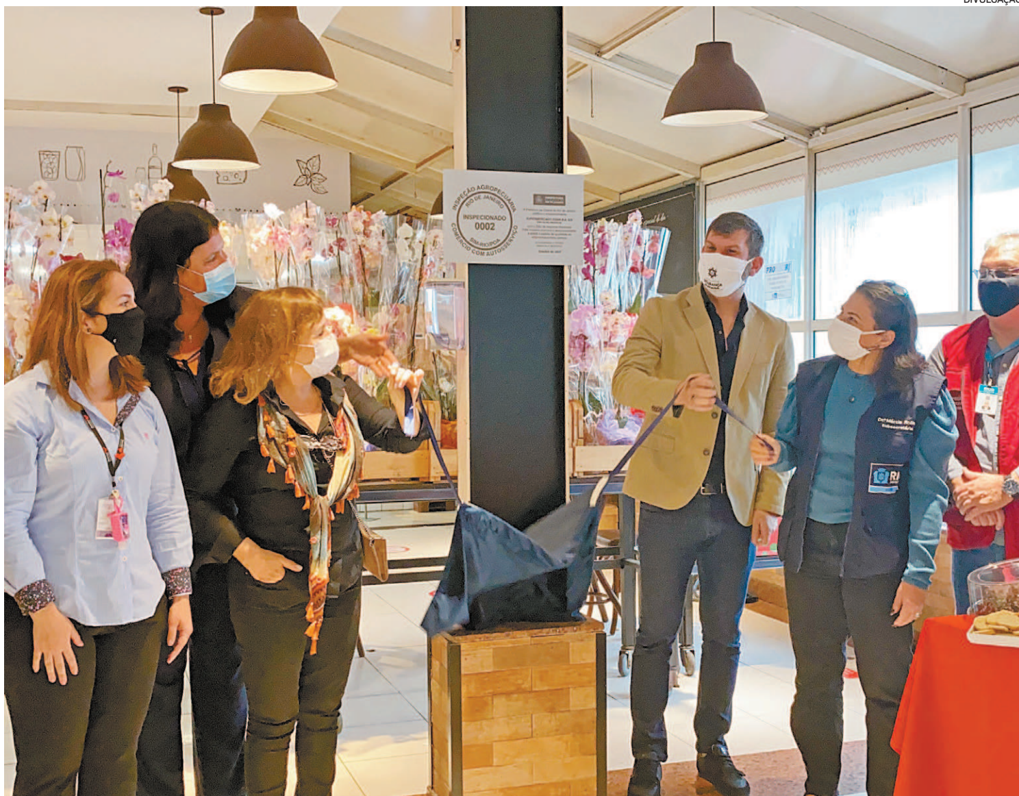
A cerimônia de entrega do SIM contou com a presença de autoridades municipais, representantes do setor e da rede Zona Sul

“A gente sempre procura superar a expectativa dos clientes. Com o SIM, nós pas-