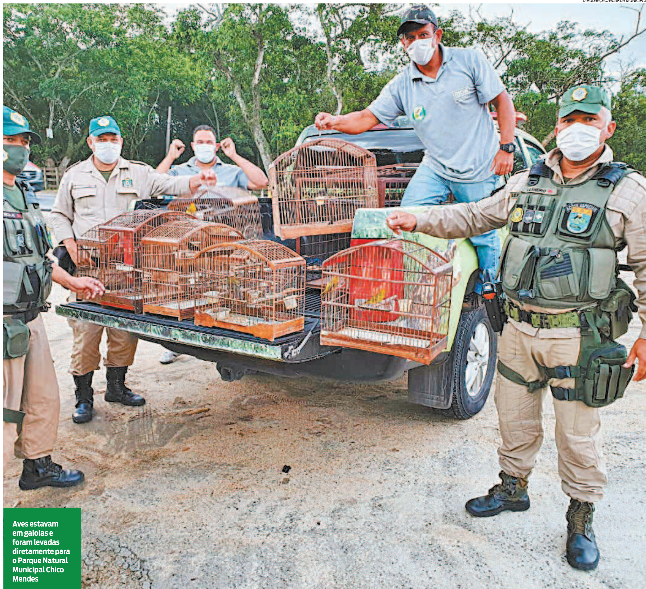
Aves estavam em gaiolas e foram levadas diretamente para o Parque Natural Municipal Chico Mendes