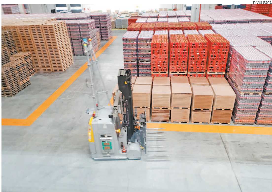
O grupo Coca-Cola Andina tem 11 fábricas e 19 centros de distribuição espalhados pelo Brasil

Para ajudante de entregas são 120 vagas. O salário