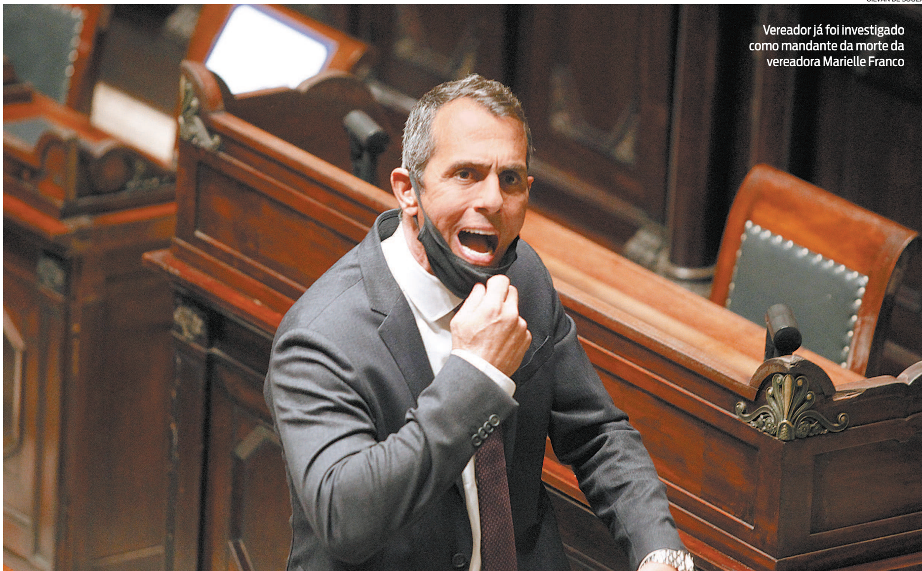
Vereador já foi investigado como mandante da morte da vereadora Marielle Franco