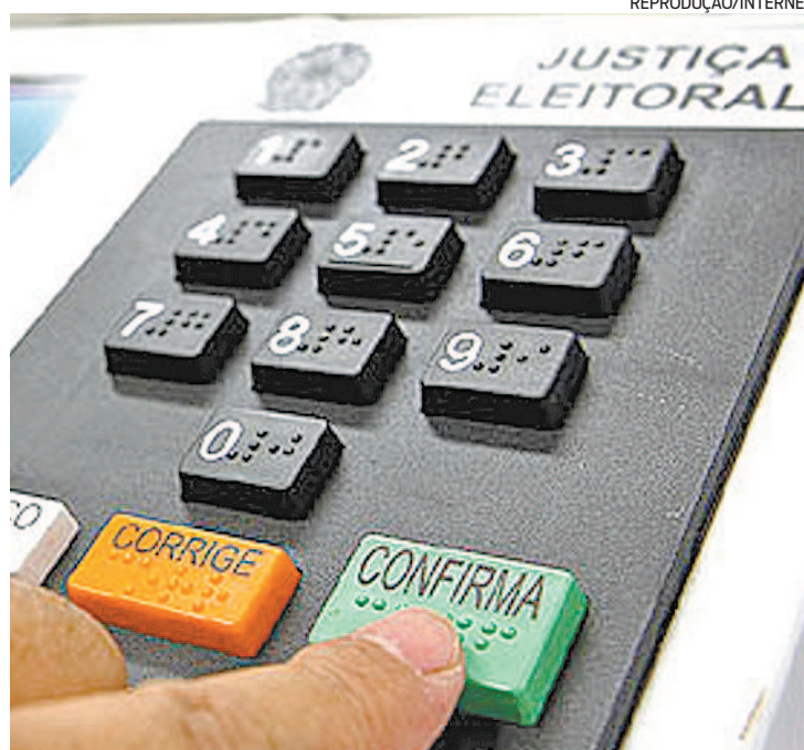
Deficientes visuais poderão ouvir o nome do candidato na hora do voto

Para utilizá-lo, o eleitor com inscrição que o identifique como deficiente visual deve informar ao mesário para que ele habilite o recur-