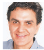
Gabriel Chalita professor e escritor

Só aos domingos minha família comia carne. O dinheiro não suportava outra possibilidade. Era minha avó quem determinava a ida ao açougue. Quantos anos eu tinha na época? Sete ou oito, talvez.