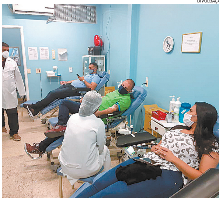
Hemonúcleo de São Gonçalo recebe doadores na clínica do Zé Garoto

lho, s/n, ao lado do Polo Sanitário Washington Luiz, no bairro Zé Garoto.