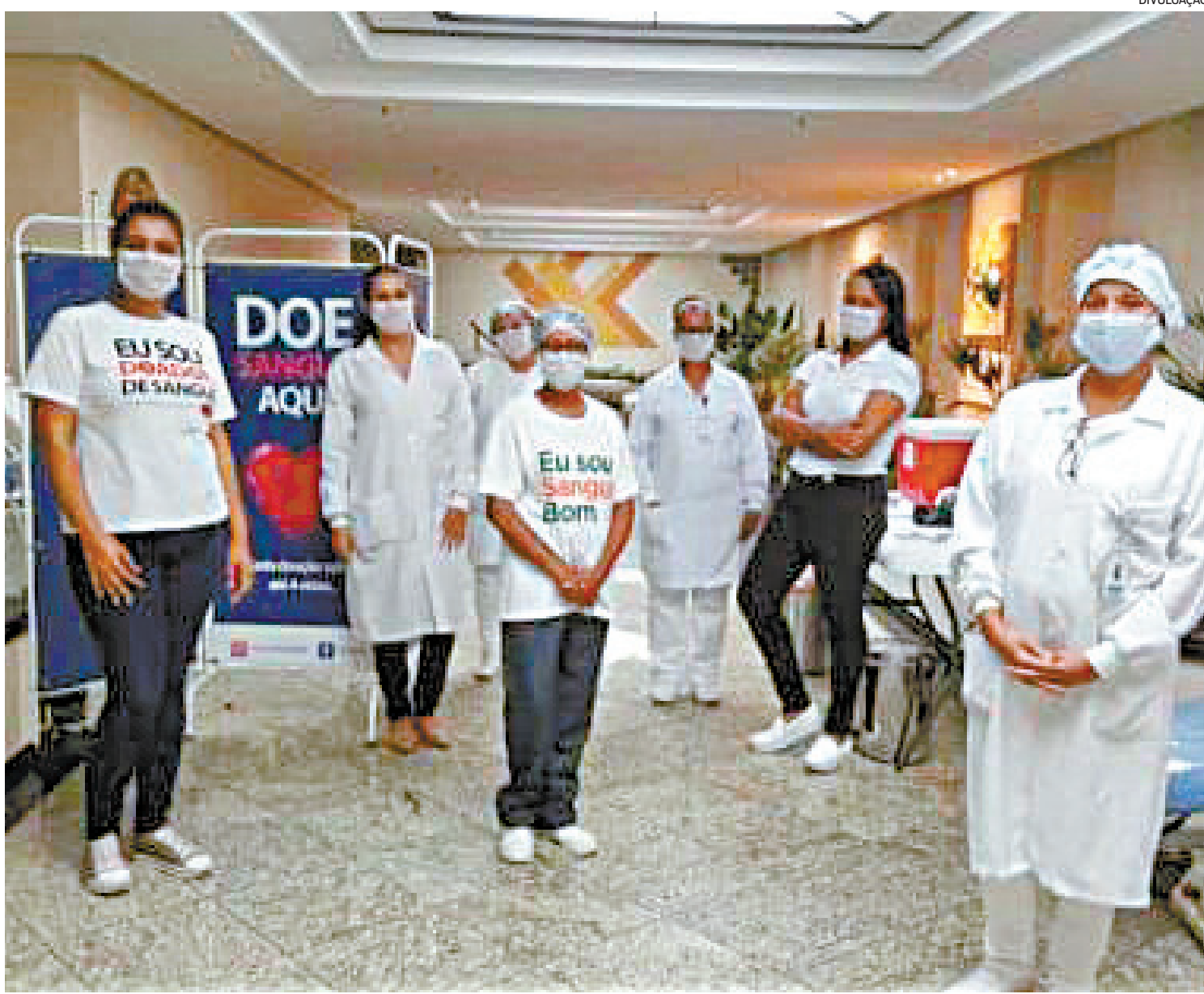
Antes de ir à casa dos doadores, equipe da Clínica de Hemoterapia de Niterói faz entrevista para saber se voluntário tem sintomas de covid-19

O Hemonúcleo de São Gonçalo também tem enfrentado diminuição dos estoques durante a pandemia do novo coronavírus. Nos últimos dois meses, segundo a direção da unidade, o número de doadores foi reduzido drasticamente. Para contribuir, as doações devem ser feitas de segunda a sexta-feira, das 7h ao meio-dia, no Hemonúcleo de São Gonçalo, que fica na Praça Estephânia de Carva-