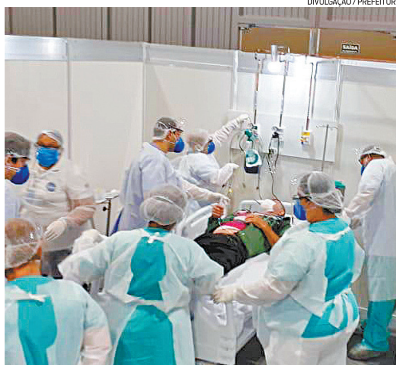
Liminar da Justiça determina abertura de novos leitos em dez dias

Ainda de acordo com o recurso, "a falta de razoabilidade da decisão recorrida fica nítida quando a própria decisão demonstra um desconhecimento da política pública municipal de combate à pandemia, das limitações circunstanciais para abertura de novos leitos, da escassez de recursos e dos critérios técnicos eleitos pela Administração".