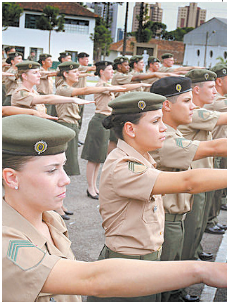
Mulheres ficarão isentas de alistamento em período de paz

Reportagem do estagiário Maria Clara Matturo , sob supervisão de Martha Imenes