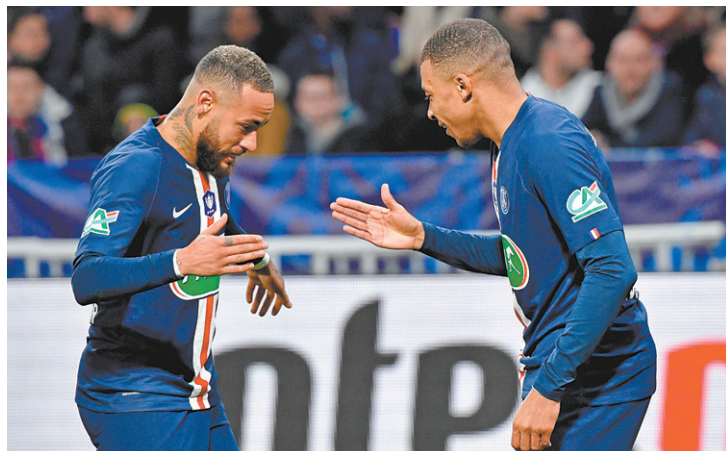
Neymar (E) e Mbappé se cumprimentam na goleada sobre o Lyon