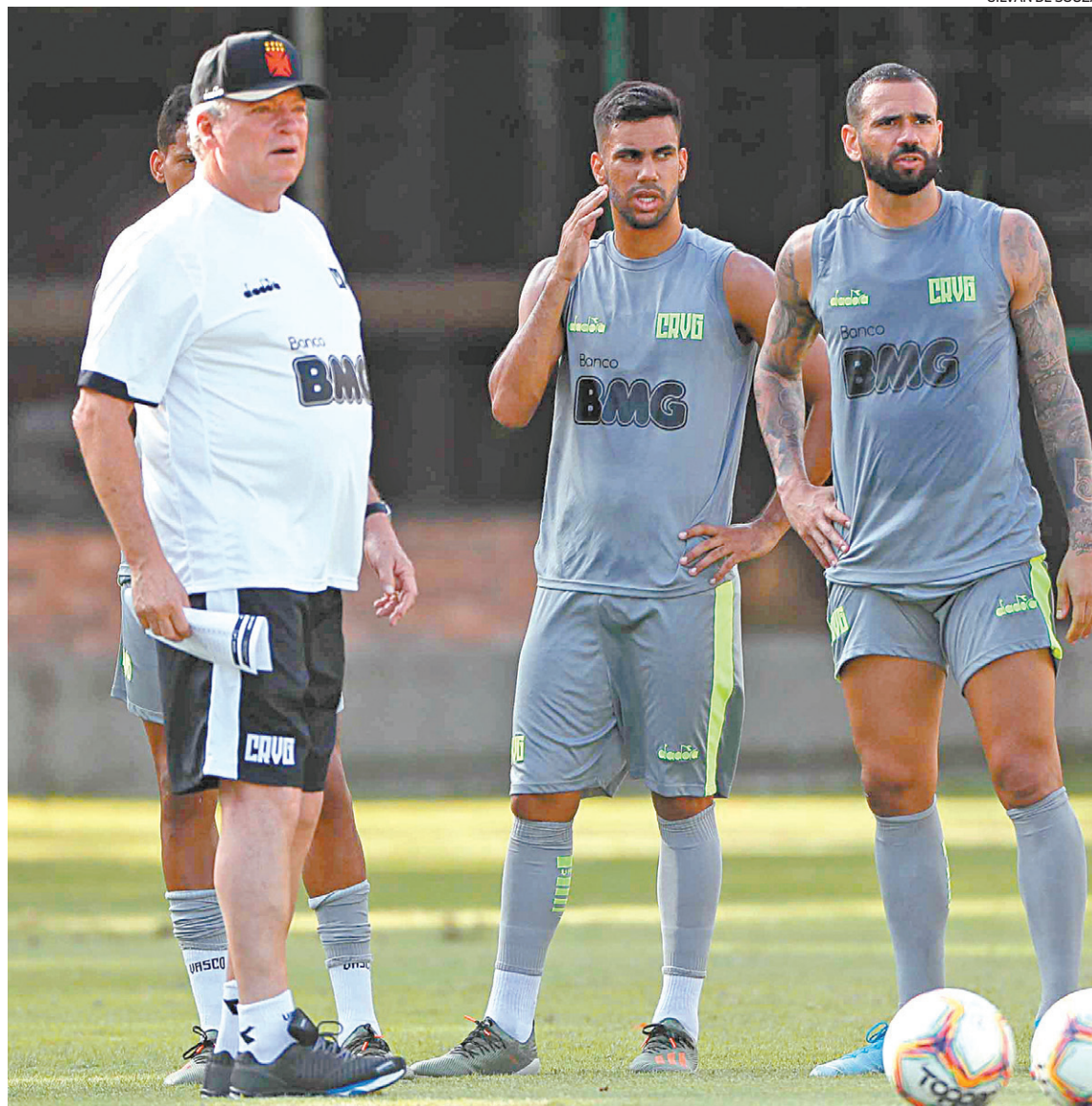
GILVAN DE SOUZA

“O vestiário está ótimo. Foi a maneira que os jogadores encontraram para mostrar que estão aqui. Esse problema não vem de duas semanas. Esse problema acontece há tempos”, avaliou o treinador.