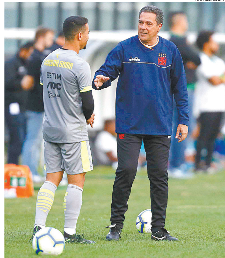
Luxemburgo enaltece o poder de superação dos jogadores do Vasco