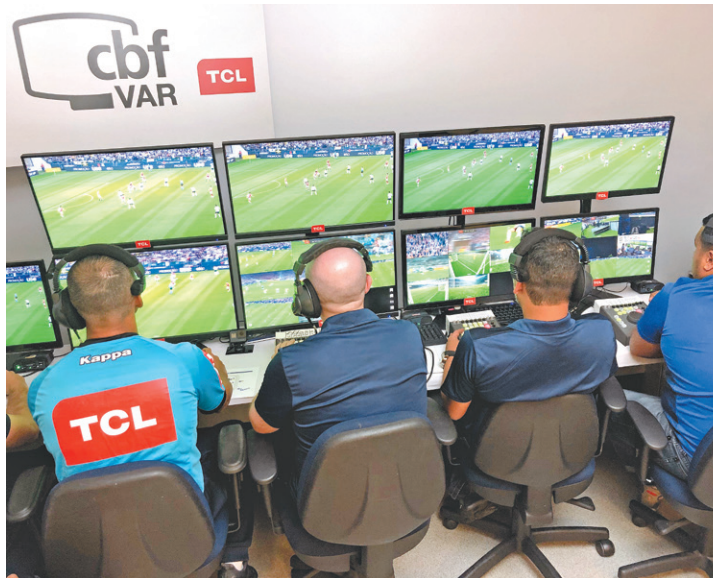
O trabalho do Árbitro de Vídeo vem provocando muita polêmica