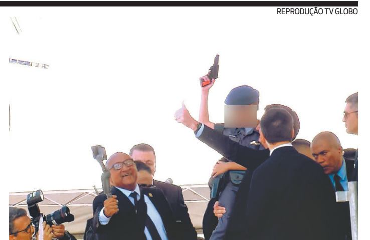
Bolsonaro pegou no colo um menino fardado de policial

A Embaixada dos EUA no Brasil divulgou nota oficial para reafirmar o apoio ao governo brasileiro.