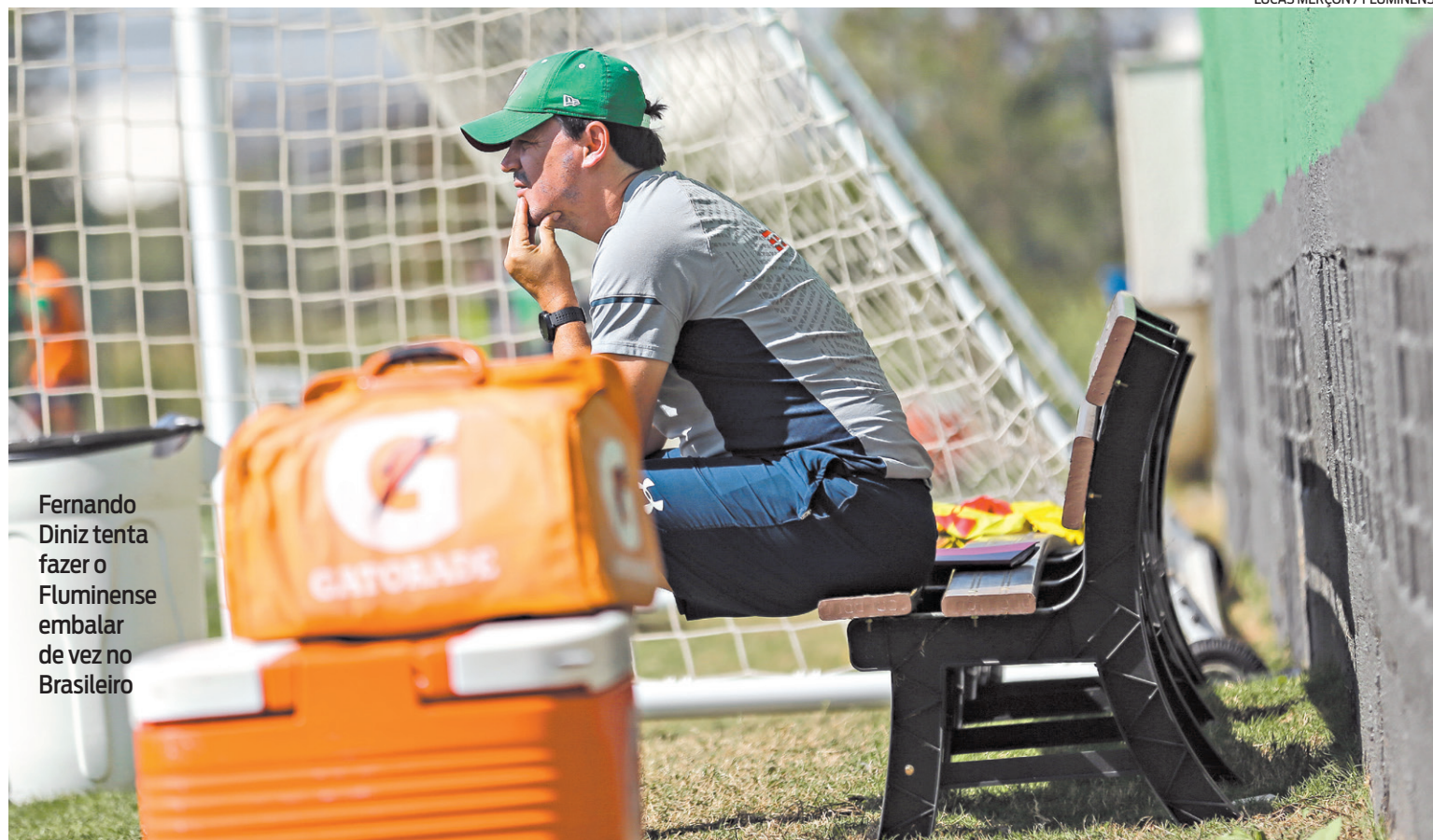
Fernando Diniz tenta fazer o Fluminense embalar de vez no Brasileiro