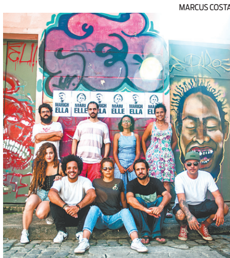
El Efecto e Canto Cego fazem show

Com performances no Equador, Argentina, Portugal e Espanha, as quase duas décadas de carrei-