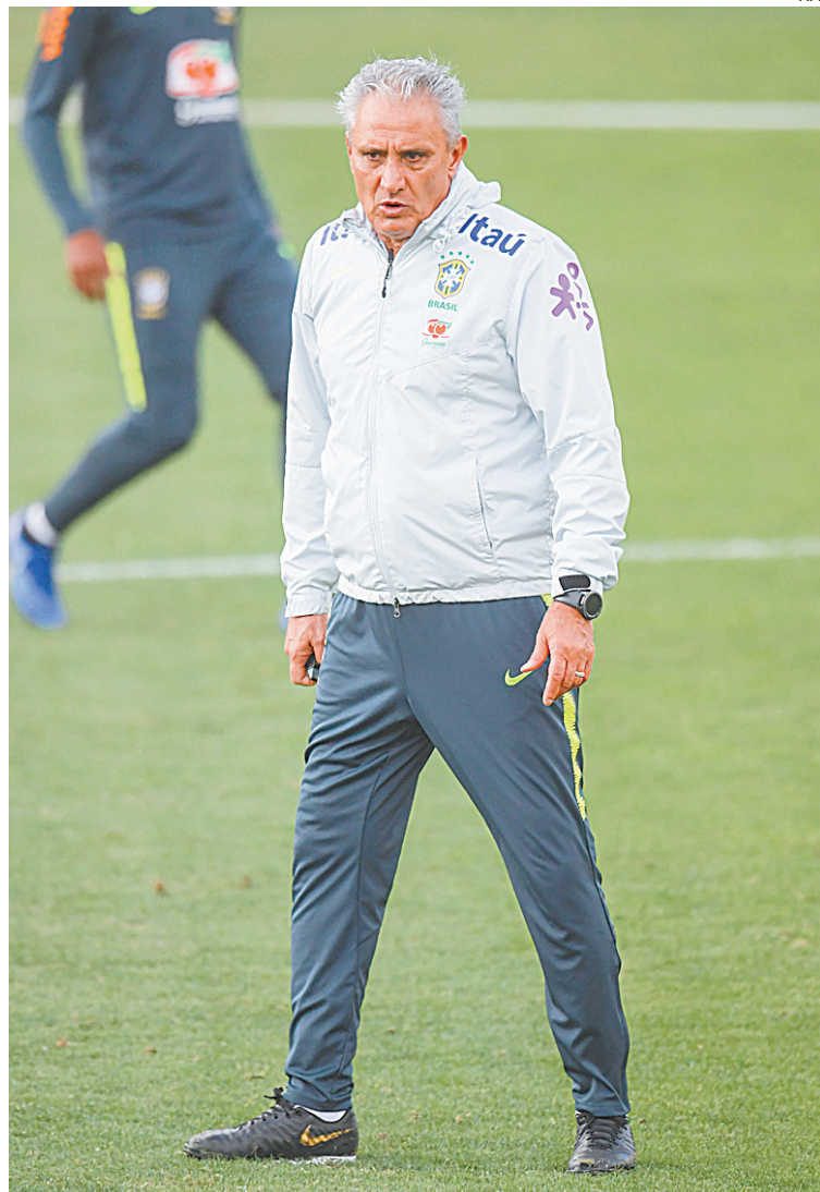
Tite comanda o último treino antes do amistoso com o Catar, em Brasília

Apesar de pouco tradicional, a seleção do Catar vive ótima fase. Convidada para participar da Copa América, a equipe vem de sete vitórias seguidas, com direito a título invicto da Copa da Ásia, em fevereiro, desbancando o favorito Japão na final por 3 a 1.