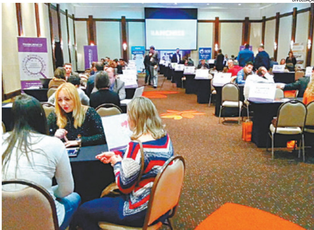
As marcas são dos setores de Alimentação, Educação e Turismo. Investimento inicial a partir de R$ 5 mil

“Percebemos a necessidade de implantar um modelo