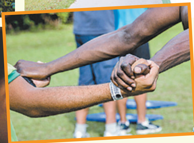
Homens participam de roda de conversa em clínica especializada em tratar transtornos