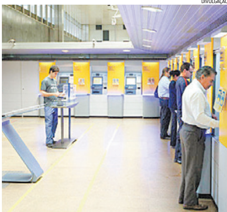
Pagamentos dos atrasados são feitos em contas do BB ou da Caixa

Para todos os TRFs do país foram liberados R$ 857,5 milhões para quitar 63.899 ações previdenciárias. Esses recursos foram liberados