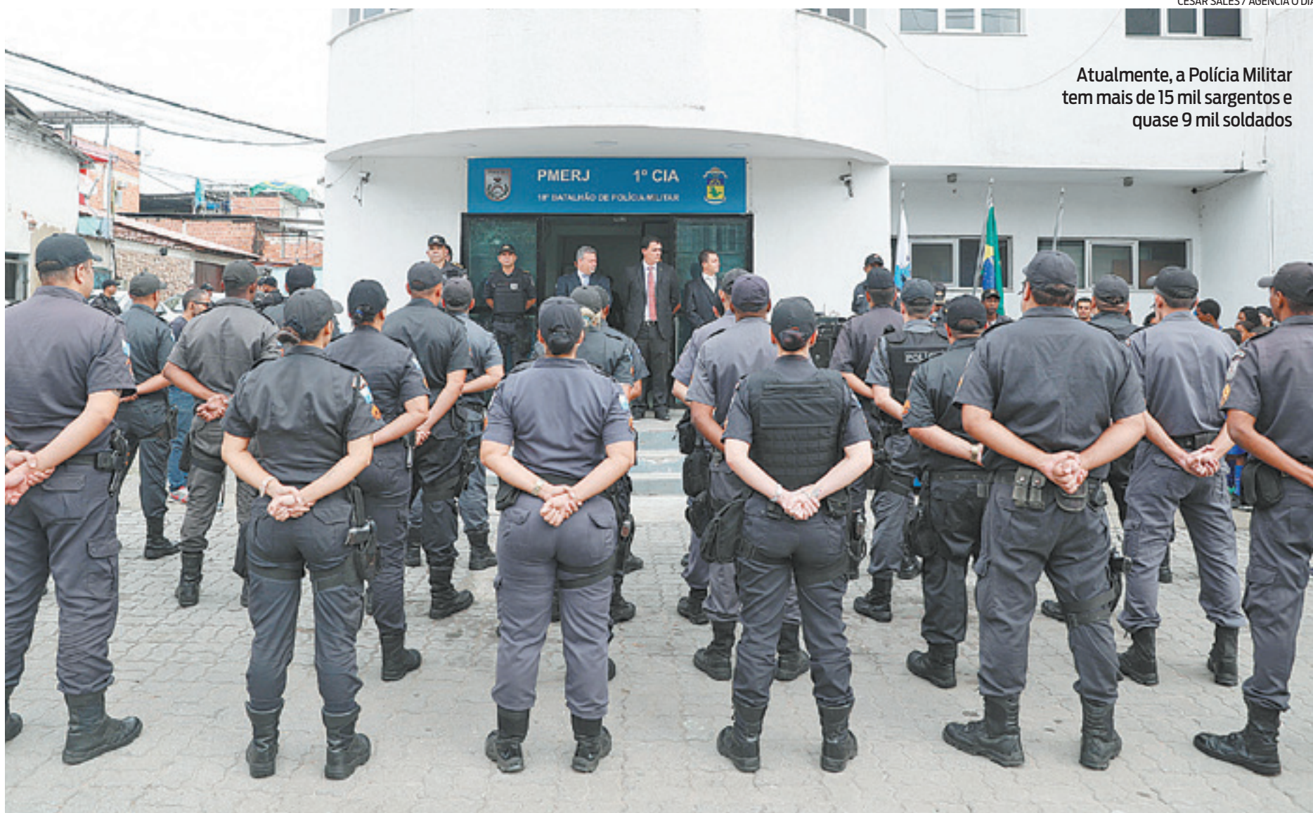
Atualmente, a Polícia Militar tem mais de 15 mil sargentos e quase 9 mil soldados

Já em 2012, a situação se agravou com uma decisão