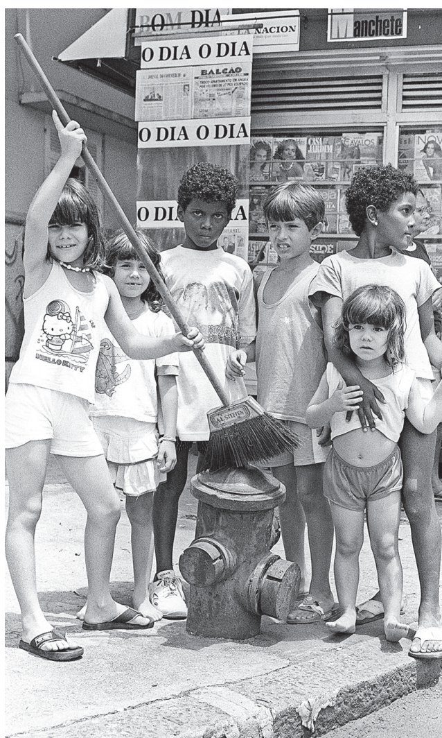
AG O DIA

Com 120 quilos de ferro maciço, o hidrante virou alvo de cuidados da turma da Rua Sílvio Fialho, em Jacarepaguá, em janeiro de 1992. A campanha 'Adote um hidrante' foi ideia do comandante do Centro de Suprimento D'Águas para Incêndio do Corpo de Bombeiros e virou uma forma de os pequenos aprenderem sobre segurança e preservação do mobiliário urbano.